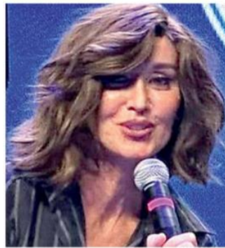
Il ministro Anna Maria Bernini

“Frontiera Africa” è il tema della terza edizione di “One Health Award”, l’evento sulla salute unica uomo-animale-ambiente organizzato dall’11 al 13 ottobre dall’Istituto zooprofilattico. ■ A PAGINA 16